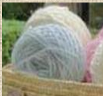
材料はアメリカ製