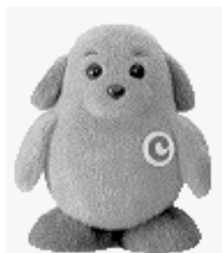
税関イメージキャラクター