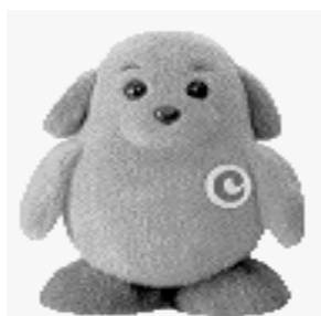
税関イメージキャラクター