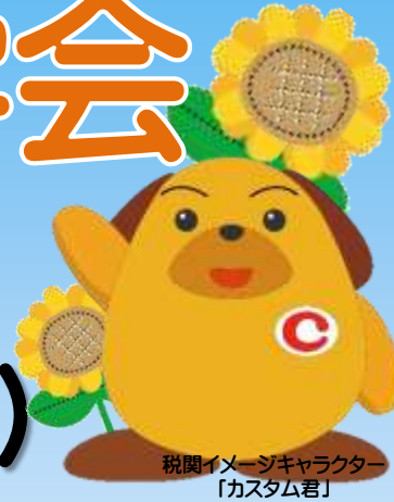
税関イメージキャラクター「カスタム君」