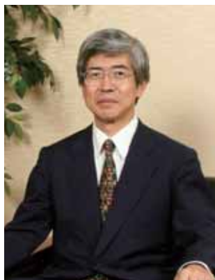
ЮКИЯСУ АОЯМА Генеральный директор, Управление таможни и тарифов, Министерство Финансов, Япония

Учитывая обширный опыт и знания г-на МИКУРИЯ, а также его высочайшие руководящие способности, я уверен, что он мог бы быть лучшим кандидатом как для ВТО, так и для стран-участниц.