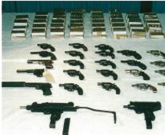
昭 63.5.14 船舶の入港尋問時の不審情報を糸口に摩耶埠頭出張所に輸入申告があった大理石ビリヤードテーブルから機関短銃 2 丁、けん銃 23 丁、実包 2,319 発を摘発した。