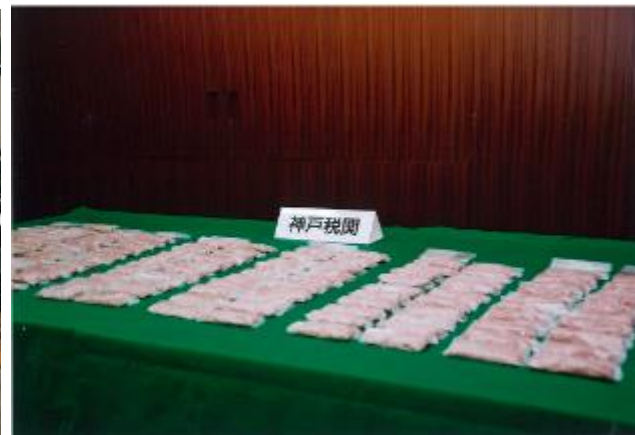
平 16.7.16 六甲アイランド出張所の木製テーブルの輸入検査において、天板に隠匿された MDMA60,255 錠を摘発した。