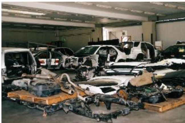
平 14.6.10 六甲アイランド出張所の中古オートパーツの輸出検査において、証明書と現物対査の際不審点を発見したことから警察に通報し、盗難車 14 台分の自動車部品を発見した。