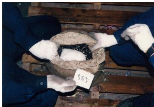
平 11.4.13 境税関支署において、海保と合同で本船から出構した乗組員に対して職務質問を実施したところ、所持していた鞆から覚醒剤約 1kg を発見し摘発した。さらに活しじみの輸入検査において、麻袋 99 袋から覚醒剤約 99kg を摘発した。