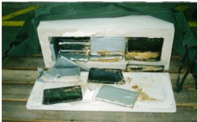
平 8.5.30 六甲アイランド出張所に輸入申告された大理石からテープで巻かれた 39 個の包みを発見し、過去最大量の大麻樹脂 38kg を摘発した。