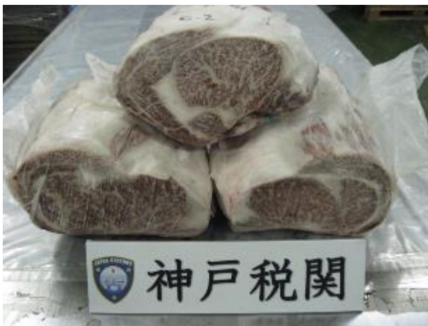
平 25.10.21 六甲アイランド出張所の廃プラスチックの輸出検査においてコンテナ最奥部に隠匿された冷凍牛肉 5,710kg を摘発した。