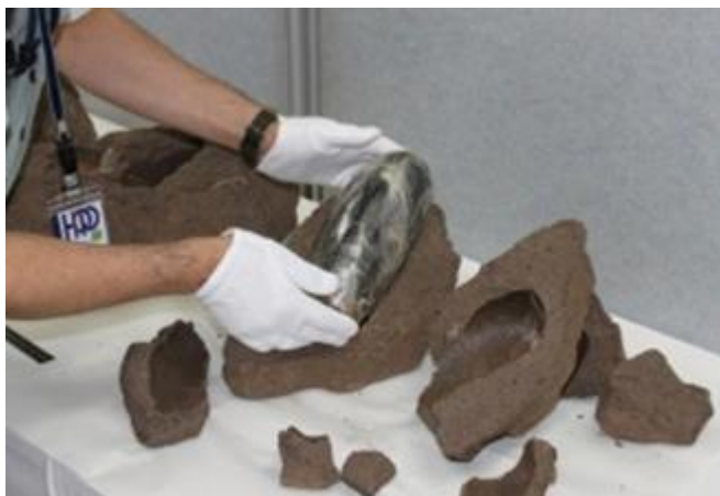
平 25.5.13 ポートアイランド出張所の鉄鉱石の輸入検査においてコンテナから模造鉄鉱石に隠匿された覚醒剤 193 個（約 194kg）を摘発した。