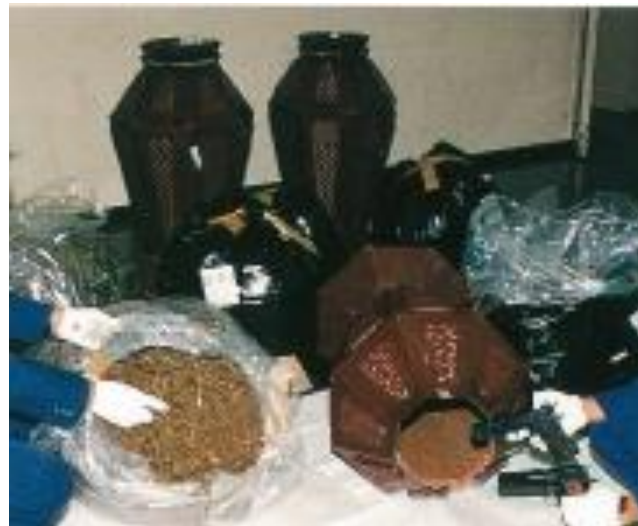
平元.12.7 六甲アイランド出張所に輸入申告があった木製置物から神戸港における過去最高の大麻草 33kg とけん銃 2 丁を摘発した。