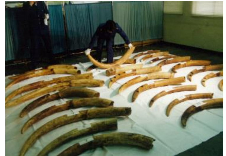
平 4.2.28 ポートライント出張所の輸入検査において、コンテナを改造して隠匿してあった象牙 27 本 (372kg) を発見した。