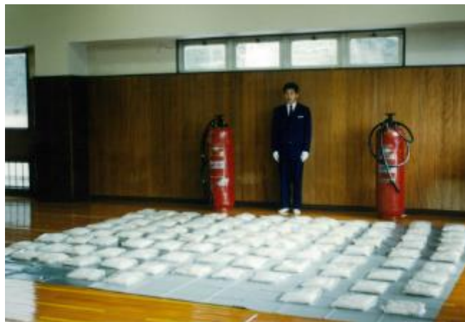
平 11.1.7 浜田税関支署において、警察、海保と合同船内捜索を実施し、機関室に置かれていた大型消火器内から覚醒剤約 101kg を摘発した。