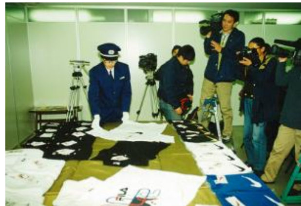
平 9.12.11 六甲アイランド出張所に輸入申告された T シャツのコンテナに隠匿されていた有名ブランドの T シャツ商標権侵害衣類約 14 万点及び下げ札 10 万点を摘発した。過去最大の商標権侵害物品事件となった。