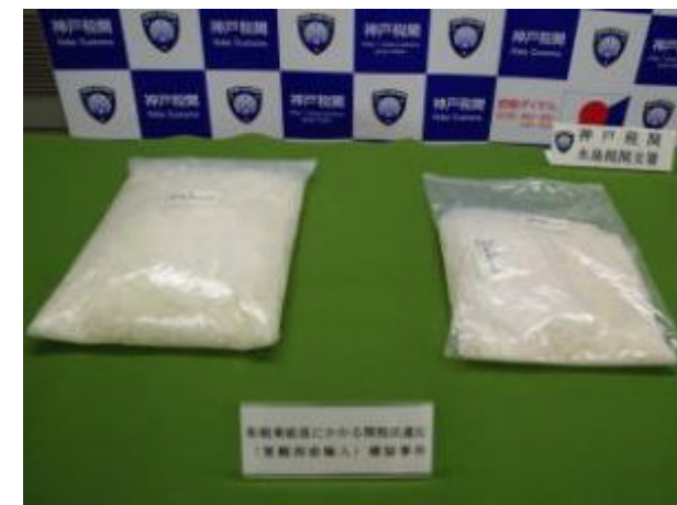
平 27.12.22 水島税関支署において、休暇下船のため上陸した乗組員の手荷物検査を実施したところ、所持していたリュックサックから覚醒剤約 6kg を摘発した。