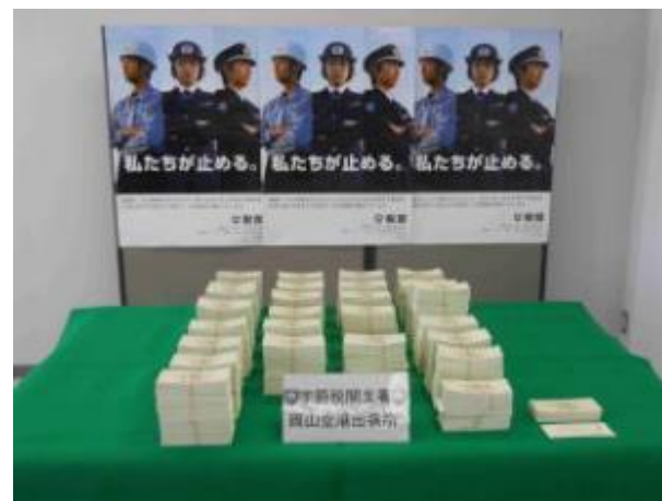
平 24.3.14 宇野税関支署岡山空港出張所において、定期便の入国検査実施中、旅客が所持していたスーツケースに隠匿された偽造有価証券 28,286 枚（額面 28,286,000 円分）を摘発した。