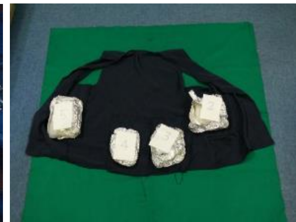
平 20.3.6 坂出税関支署高松出張所において、本船から出構した乗組員に対して職務質問したところ、着用していた特製のベストに隠匿されていた覚醒剤約 1.3kg を摘発した。