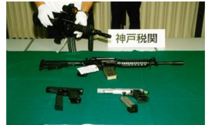
平 11.6.24 ポートアイランド出張所に輸入申告された木製の額縁から自動小銃 2 丁、けん銃 2 丁及び実包 408 発を X 線検査によって発見した。