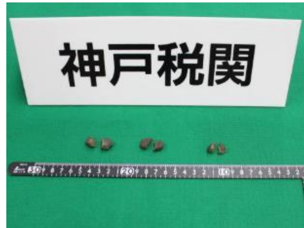
平 27.12.14 ポートターミナルにおいて国際フェリーの入国検査実施中、麻薬探知犬の反応を糸口に検査したところ、着用中の靴下中から隠匿されていた大麻樹脂 3 塊を摘発した。