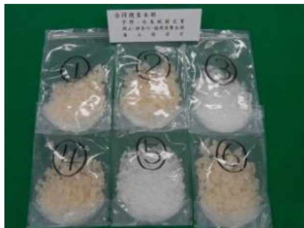
平 23.11.11 宇野税関支署において、警察、海保と合同張込中、本船から出構した乗組員に対して職務質問を実施したところ、身辺に巻き付け隠匿されていた覚醒剤約 3kg を摘発した。