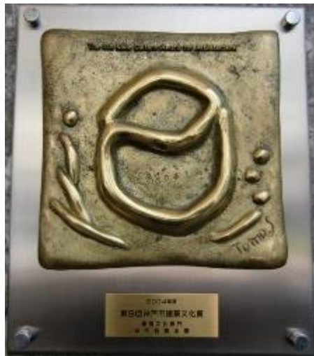
平 17.2 神戸市建築文化賞

社団法人建築業協会の初代理事長の発意によって、昭和 35 年に創設されたもの。日本国内の良好な建築資産の創出を図り、文化の進展と地球環境保全に寄与することを目的に、毎年、国内の優秀な建築物が表彰されている。