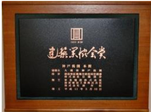
平 12.11 第 41 回建築業協会賞（BCS 賞）

社団法人建築業協会の初代理事長の発意によって、昭和 35 年に創設されたもの。日本国内の良好な建築資産の創出を図り、文化の進展と地球環境保全に寄与することを目的に、毎年、国内の優秀な建築物が表彰されている。