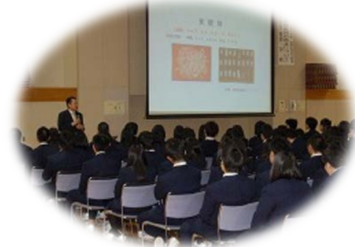
↑ 薬物乱用防止教室（税関教室）の様子 ↓

税関広報広聴官（☎0138-40-4218）又は最寄りの税関支署・出張所（連絡先は こちら ）まで、お気軽にご連絡下さい！