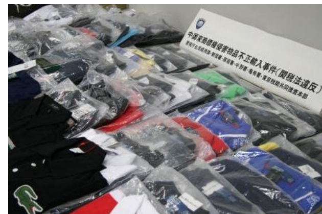
押収した商標権侵害物品

中華人民共和国から到着した国際スピード郵便物(EMS)25個から商標権を侵害するシャツ、靴、ベルト等110点を摘発しました。