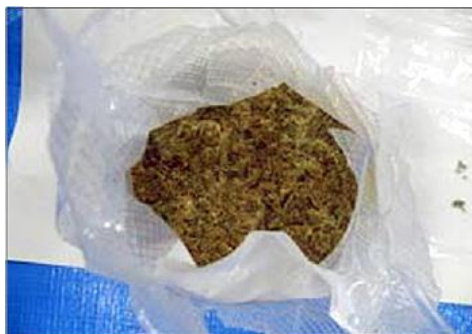
隠匿されていた大麻草