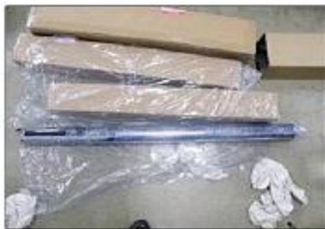
プロペラシャフト内に隠匿

アメリカ合衆国から到着した航空貨物から、大麻草約40kgを摘発しました。大麻草は、自動車部品のプロペラシャフト内に隠匿されていました。