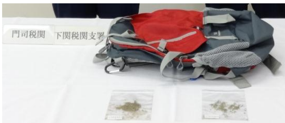
リュックサック内に隠匿

大韓民国から到着したフランス人旅客に対する携帯品検査により、リュックサック内に隠匿していた大麻草約2gを発見、摘発しました。