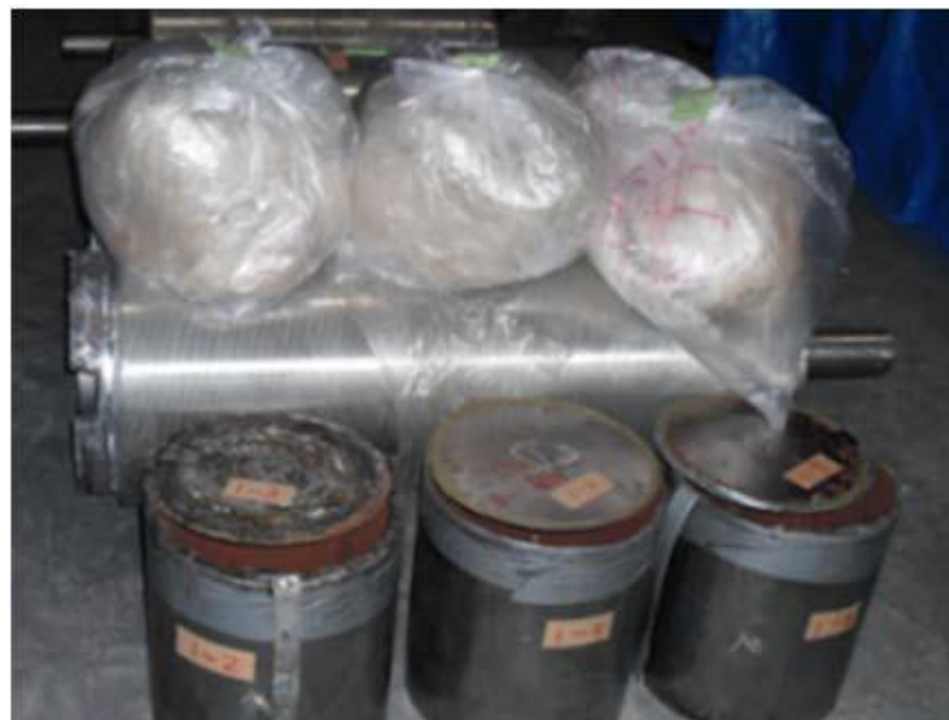
覚醒剤が隠匿されていた製粉機（左）と製粉機内部のローラー部分（右）