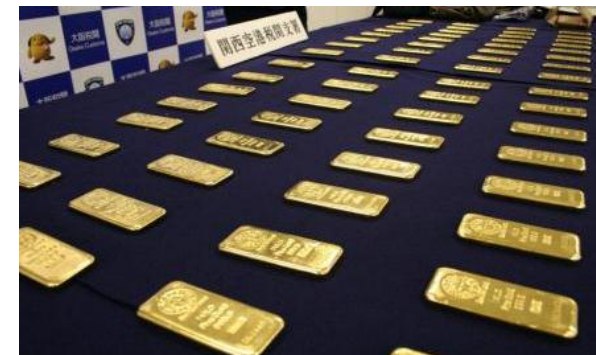
手提げ袋等に分散隠匿

大韓民国から到着した日本人航空機旅客らから、金地金64塊(約64kg)を摘発しました。金地金は、手提げ袋等に分散隠匿されていました。