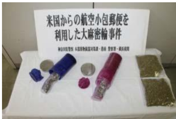
ろうそく2本内に隠匿

米国から到着した航空小包郵便物から大麻約500gを摘発しました。大麻は、ろうそく2本内に隠匿されていました。