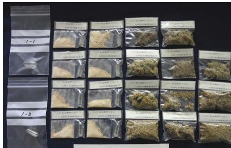
隠匿されていた大麻草及びMDMA

アメリカ合衆国から到着した航空貨物から、大麻草約21.4g及びMDMA10カプセルを摘発しました。大麻草及びMDMAは、コーヒー袋内に隠匿されていました。