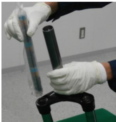
自転車部分品内に隠匿

米国から到着した航空小包郵便物から液体状の大麻約81gを摘発しました。大麻は、自転車部分品内に隠匿されていました。