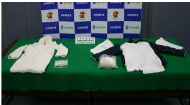
バスローブ及びジャンパーに染み込ませ隠匿

スイス連邦から到着したドイツ人航空機旅客から、覚醒剤約1.9kgを摘発しました。覚醒剤は、バスローブ及びジャンパーに染み込ませ隠匿されていました。