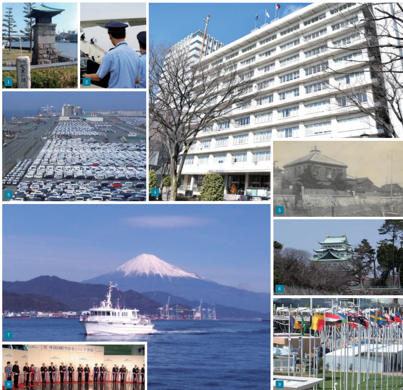
1 七里の渡し跡 2 G7伊勢志摩サミット（機側通関） 3 三河港 4 本関庁舎 5 名古屋港開港当時の名古屋税関支署庁舎 6 名古屋城 7 監視艇と富士山 8 中部国際空港開港 9 愛知万博

名古屋税関は、管内企業と海外を結ぶ重要な結節点として大きな役割を担っています。不正薬物、テロ関連物資等の密輸阻止により、安全・安心な社会の実現を目指すことはもとより、貿易関係者の方々とのパートナーシップの強化にも取組み、貿易円滑化を推進することを通じて、地域経済の発展にも貢献していくこととしています。