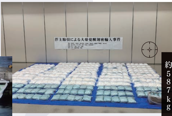
洋上取引による大量覚醒剤密輸入事件