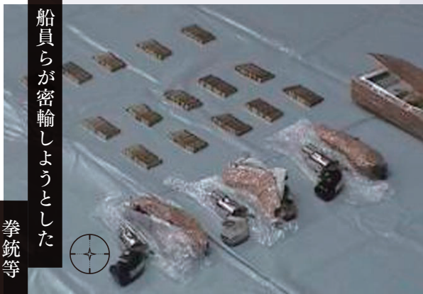
船員らが密輸しようとした