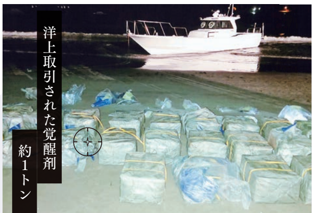
洋上取引された覚醒剤