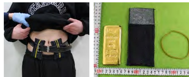
(令和5年3月、門司税関)

密輸情報の提供にご協力ください 密輸ダイヤル(24時間受付) 0120-461-961