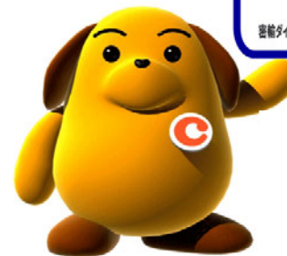
税関イメージキャラクター・カスタム君

密輸情報の提供にご協力ください 密輸ダイヤル(24時間受付) 0120-461-961