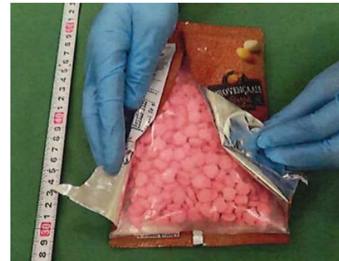
(令和5年5月、横浜税関)

チェコから到着した国際郵便物から、プラスチック製袋に隠匿されたMDMA約15,000錠を摘発しました。