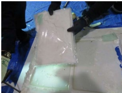
(令和5年3月、東京税関)