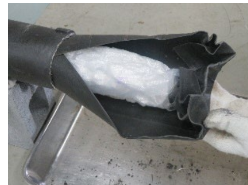
(令和5年4月、東京税関)

アメリカから到着した航空貨物から、自動車用シャフト様のもの内に隠匿された覚醒剤約3キログラムを摘発しました。