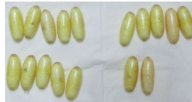
(令和5年12月、東京税関)

南アフリカから入国した旅客から、嚥下隠匿したコカイン約1キログラム(124塊)を摘発しました。