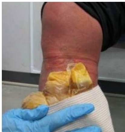
(令和5年1月、東京税関)