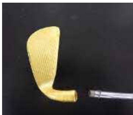
(令和5年11月、神戸税関)

香港から到着した海上貨物から、コンプレッサー8台に分散隠匿された金地金約16キログラム(40塊)を摘発しました。