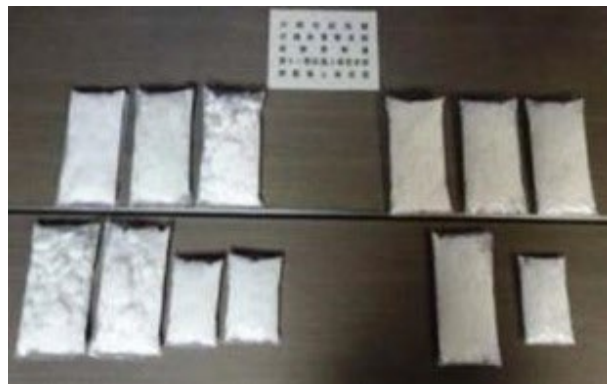
(平成28年12月 沖縄地区税関)