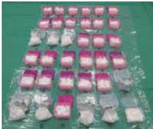
(令和5年9月、東京税関)