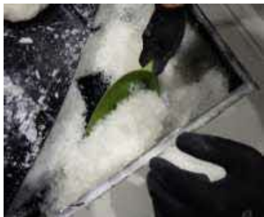
(令和5年7月、大阪税関)