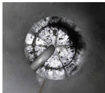
(令和5年6月、大阪税関)