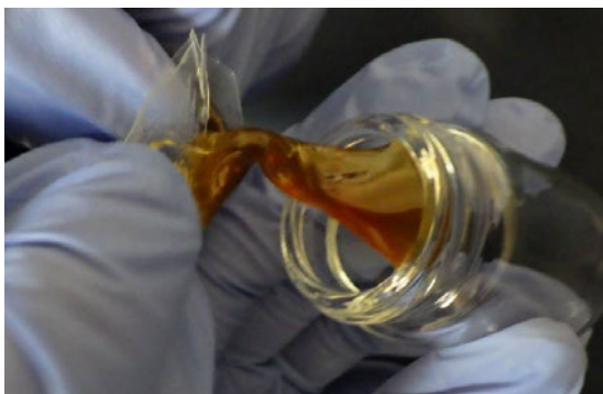
(令和5年7月、大阪税関)