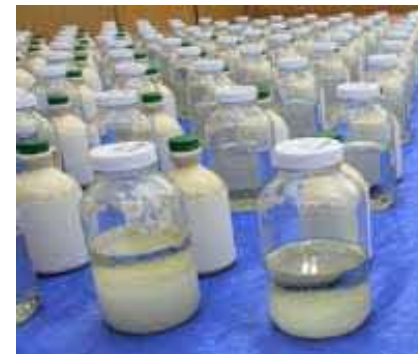
(令和5年6月、横浜税関)

カナダから到着した海上貨物から、メープルシロップに隠匿された覚醒剤約116キログラムを摘発しました。