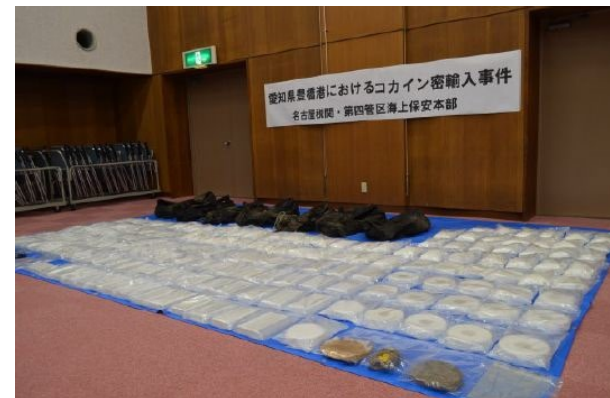
(令和元年8月 名古屋税関)

三河港（豊橋）に入港した外国貿易船の船底にある海水取入口の空所に隠匿されたコカイン約178キログラムを摘発しました。