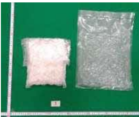
(令和5年3月、名古屋税関)