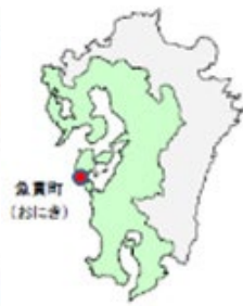
(令和元年12月、門司税関及び関係する各税関)