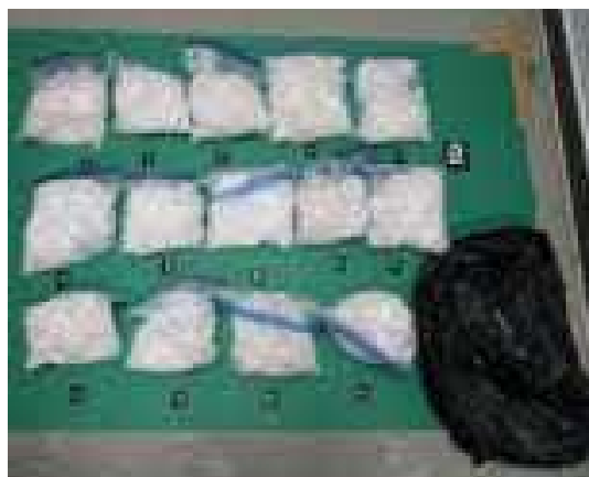
(令和5年7月、東京税関)