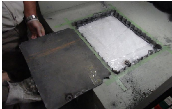
(令和3年4月、横浜税関)