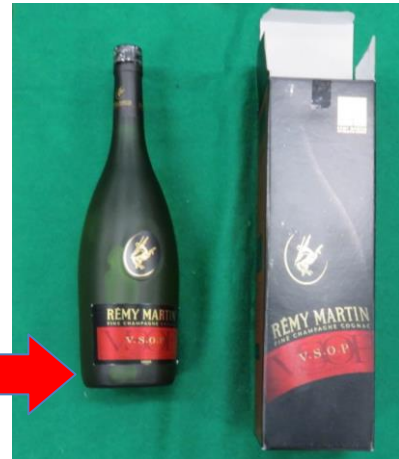
箱から取り出した状態