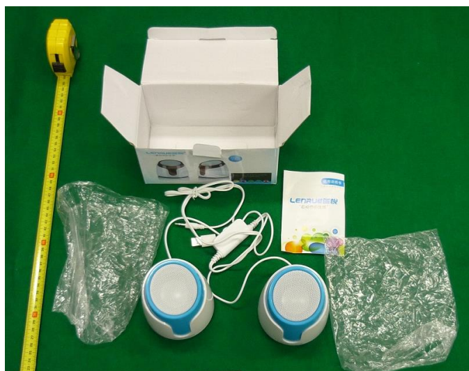
スピーカー箱の内容物