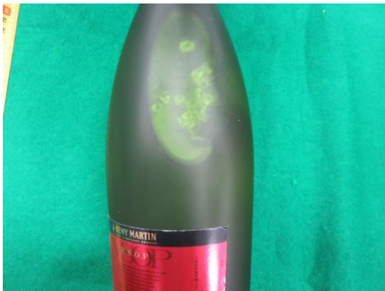
瓶内部に付着した白色結晶