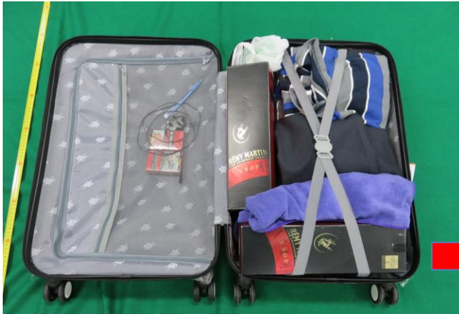
スーツケースを開けたところ

平成27年6月、中部国際空港において、中華人民共和国香港特別行政区から到着したマレーシア人男性が洋酒瓶2本内に水で溶かして隠匿していた覚醒剤1,369.6gを摘発した。