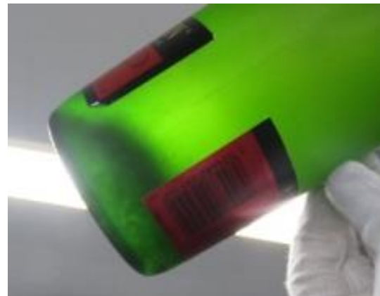
瓶内部に沈殿している白色結晶