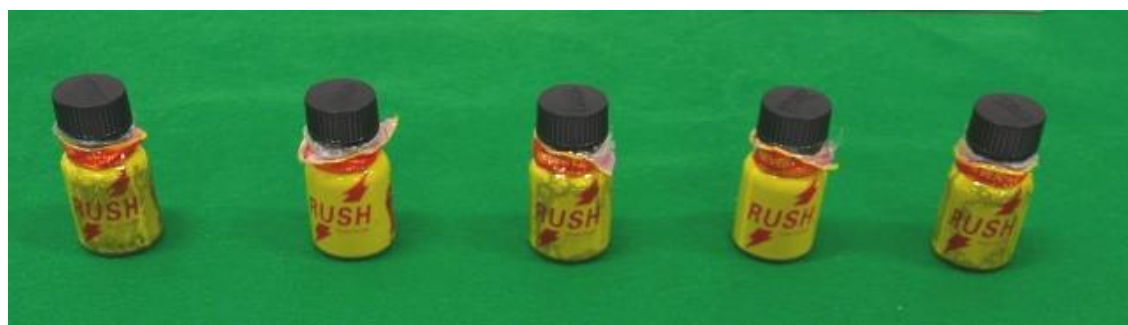
5本 正味重量 38.675 グラム