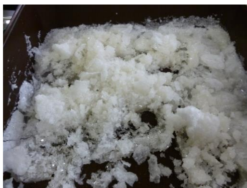
水溶液に溶けていた白色結晶