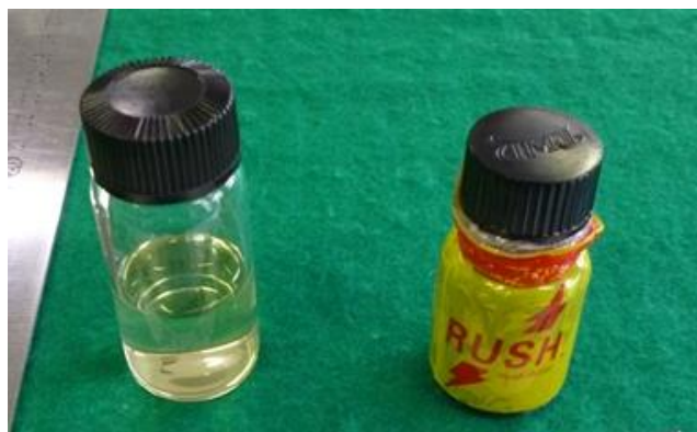
液体を別の瓶に移したもの